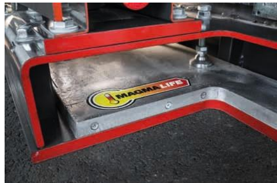
Calentamiento hasta un 60 % más rápido – sistema de calefacción MAGMALIFE.