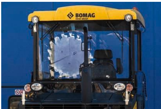
Tejadillo opcional – para un máximo confort.